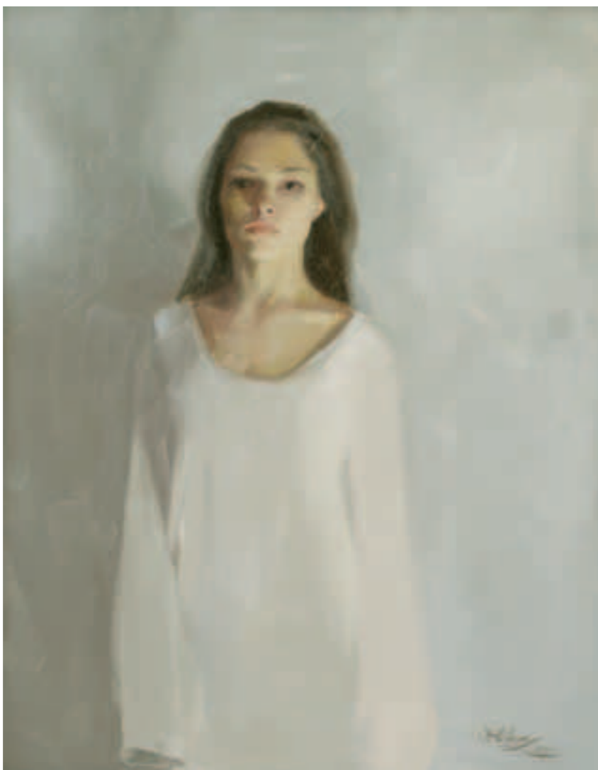
? olieverf op linnen 80 x 100 cm, 2014