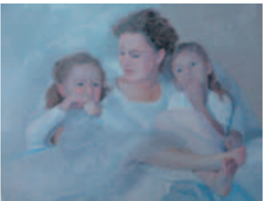
Moeder en kinderen olieverf op linnen 80 x 100 cm, 2014