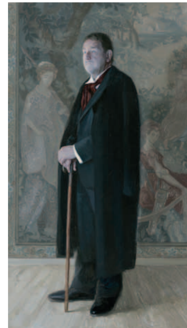
Voorzijde: Jean Peirre Rawie olieverf op linnen 150 x 122 cm, 2014

mythologie, Bijbelse- en Middeleeuwse verhalen, jachtpartijen en het aristocratische leven met 'stripachtige' personages. Met nauwkeurig gekozen details uit deze achtergrond tafereelen en haar eigen visie en toevoeging daarop, creëert ze een verbinding tussen het heden en verleden die aansluiten bij de ervaring en interesse van de te portretteren mens. Het resultaat is een overtuigend portret met esthetiek, charme en sfeer. Ieder portret vertelt met subtiele kleursymfonieën dan ook een eigen origineel verhaal.